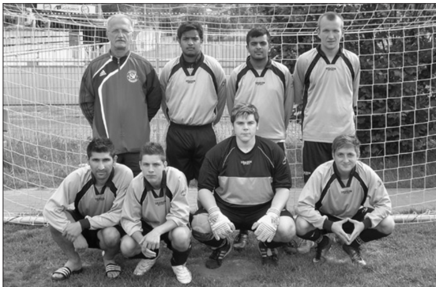
Als „Vizemeister“ beendeten die Dill-Schiris das regionale Turnier in Buseck.